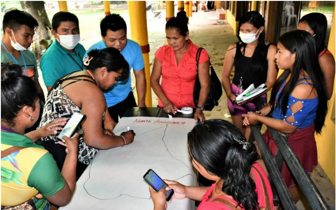
Foto: Diakonias samarbetsorganisation CEJIS (Centro de Estudios Jurídicos e Investigación Social), arbetar tillsammans med urfolksorganisationer i Bolivia för att bygga broar mellan generationer.